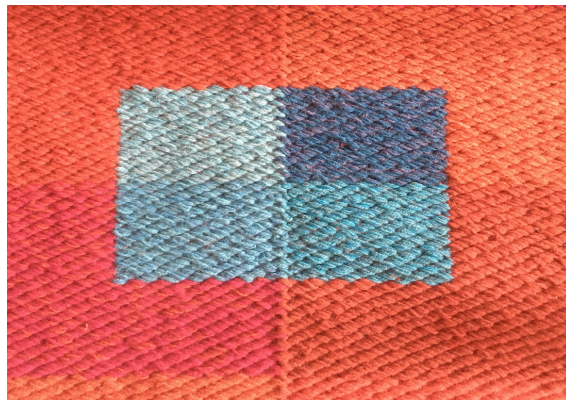
Samitum, 2 partier m. clasp Design: Danske Tæpper/ Sans & samling vævet af Lise Bjerglund 2020)